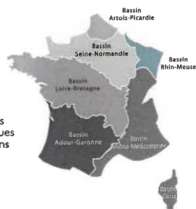
Les 7 bassins hydrographiques métropolitains

Agence de l'eau Rhin-Meuse Rozérieulles - BP 30019 57161 Moulins-lès-Metz cedex Tél. 03 87 34 47 00 agence@eau-rhin-meuse.fr