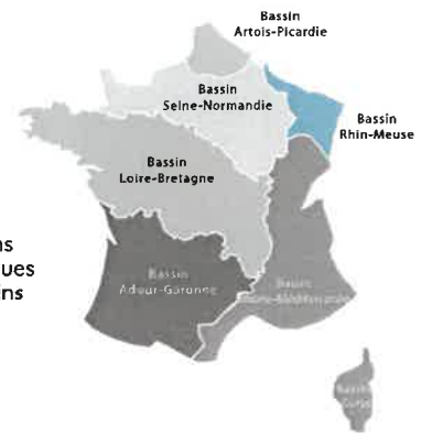
Les 7 bassins hydrographiques métropolitains

Le bassin s'étend sur 32 000 km 2 (6% du territoire national métropolitain) et compte 4,4 millions d'habitants, 8 départements et 3 230 communes.